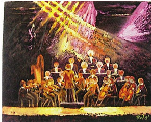
L'orchestre symphonique, huile sur toile 70x90.