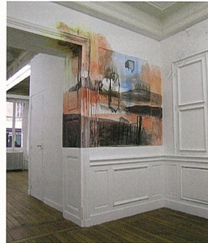
Crédit : Emmanuelle Castellan, vue de l'exposition "C'était hier", Interface appartement / galerie, Dijon - 2009

Du 12 septembre au 24 octobre 2009 Vernissage samedi 12 septembre à 18h