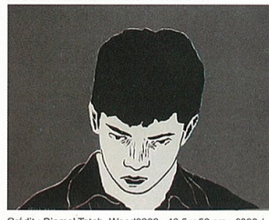
Crédit : Djamel Tatah, Wood0808, 40,5 x 50 cm - 2008 / Courtesy Atelier Michael Woolworth