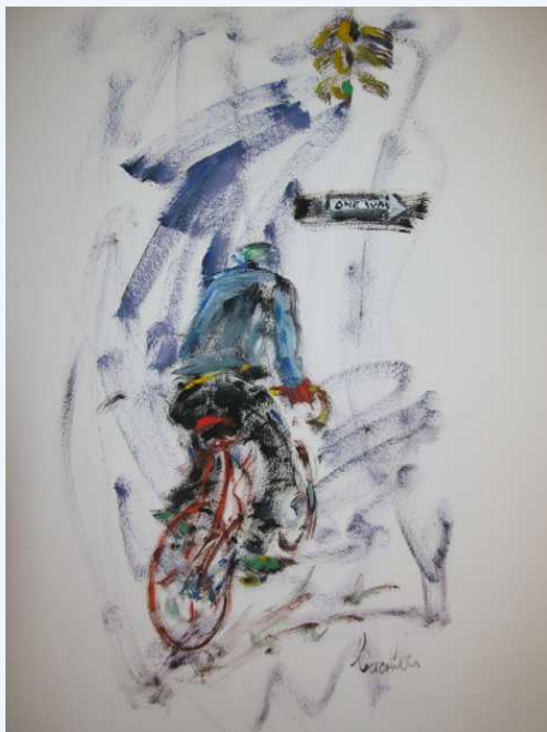
"Le cycliste à Manhattan"

Broadway, scène insolite : un saxophoniste près d'un cirreur de chaussures, individus happés par le flot tumultueux de cette mégapole.