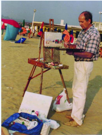
Sur la plage de Deauville