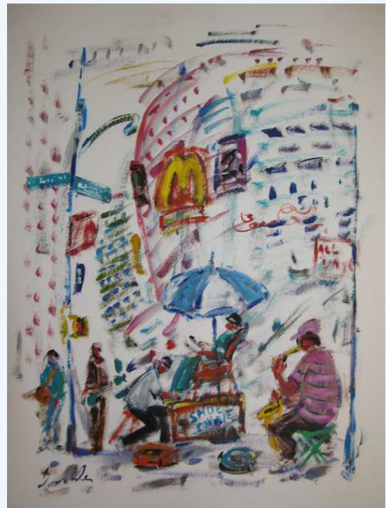
"Saxo et cirreur à Broadway"

Une vision colorée des gratte-ciels partant à l'assaut d'un azur reflet. Le regard monte ou descend le long des façades où tout n'est que couleur ; le peintre parcourt la gamme chromatique. La foule polychrome vaque à son quotidien, métro-boulot-dodo, énorme flot continu. Les notations colorées s'éparpillent significatives, véritables pulsations comme si le mouvement reprenait après un court arrêt sur image.