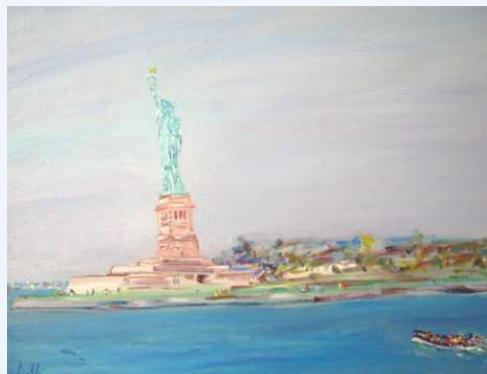
"Vers la liberté"