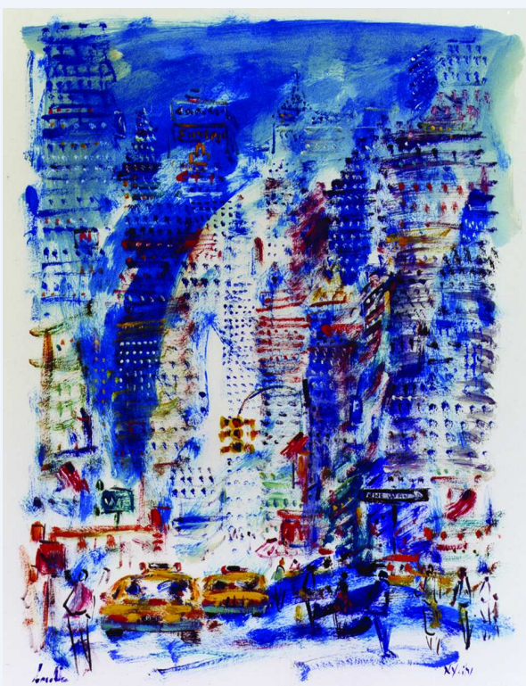
"Blue New York"