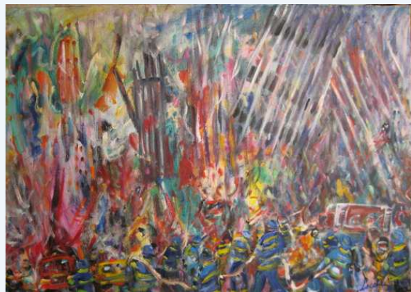
"11 septembre 2001"

La douleur insupportable nous bouscule avec cette toile qui hurle, choc ! chaos ! les couleurs se heurtent, convulsifs les traits rouges et noirs cernent les hommes, les pierres, la fumée, les cendres, la poussière. Tout s'écroule, se confond, s'aveugle, c'est le cri ultime avant le néant.