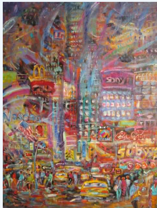
"The american way of life"

De nuit, c'est la fée électrique qui transfigure les lieux, les gratte-ciels se métamorphosent en gigantesques sapins de Noël. Moment magique, lucioles suspendues, les millions d'yeux de la ville trouent l'obscurité et rassurent.