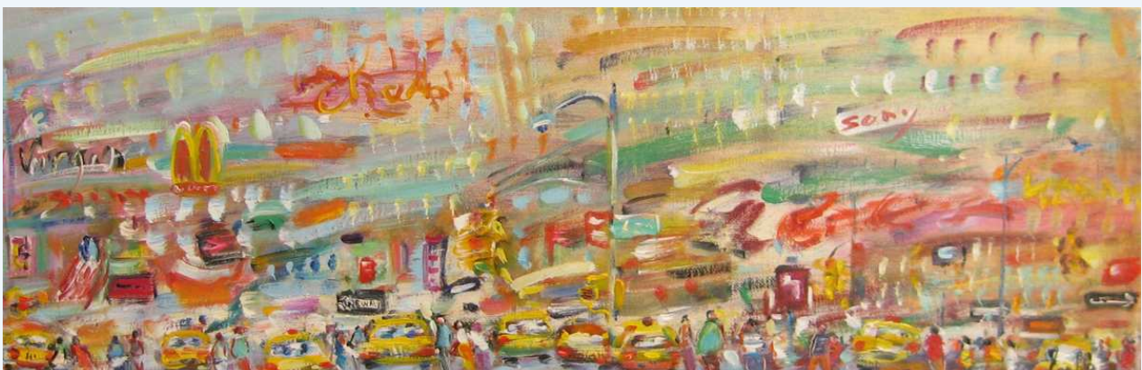
"Où est la sortie ?"

Aux toiles qui évoquent l'ascension vertigineuse, le peintre oppose celles qui découvrent la ville tentaculaire. On est piégé comme jadis Thésée.