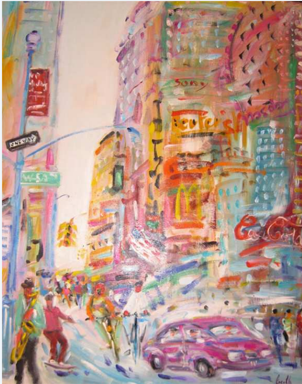
"Retour à la vie trépidante"

Une vision colorée des gratte-ciels partant à l'assaut d'un azur reflet. Le regard monte ou descend le long des façades où tout n'est que couleur ; le peintre parcourt la gamme chromatique. La foule polychrome vaque à son quotidien, métro-boulot-dodo, énorme flot continu. Les notations colorées s'éparpillent significatives, véritables pulsations comme si le mouvement reprenait après un court arrêt sur image.